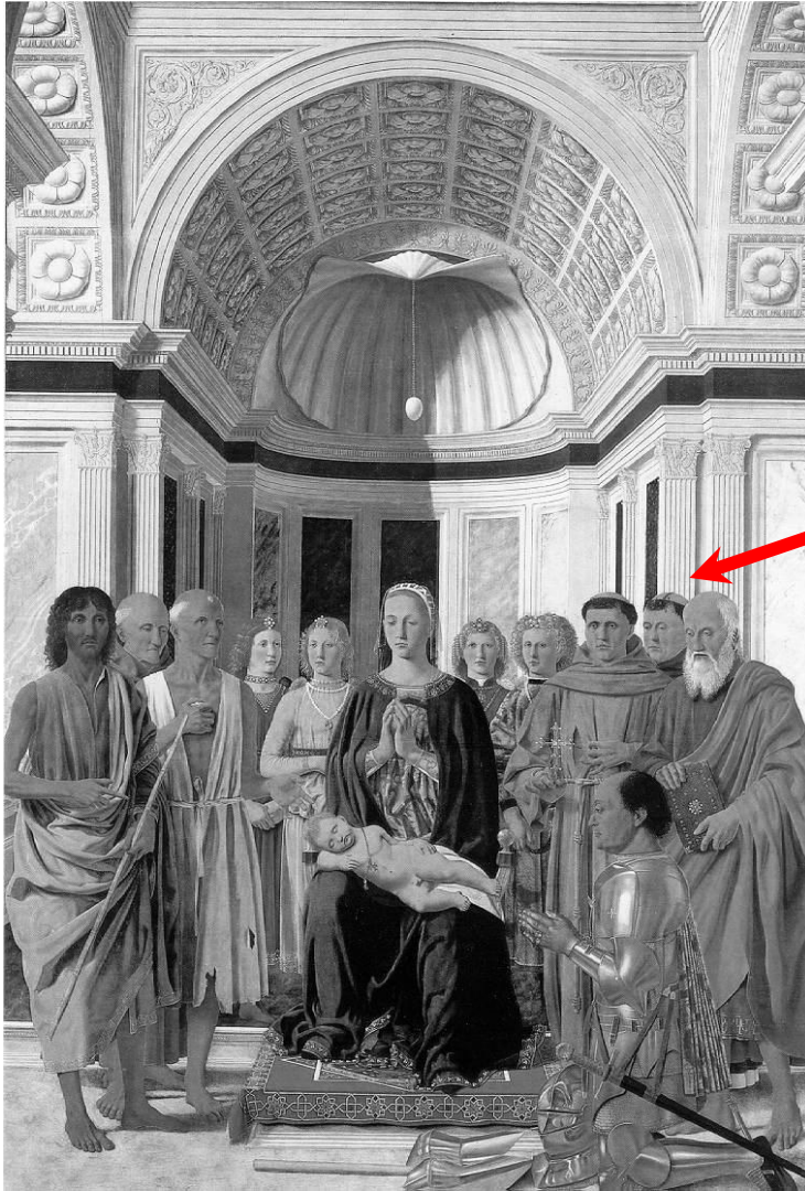
Figura 4 La Madonna col bambino - Piero della Francesca